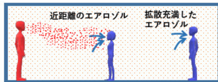
室内環境中の飛沫の挙動と伝搬の可能性

マスクの装着、飛沫放出が多い場合には直接飛沫防止境界（パーティションなど）を設置