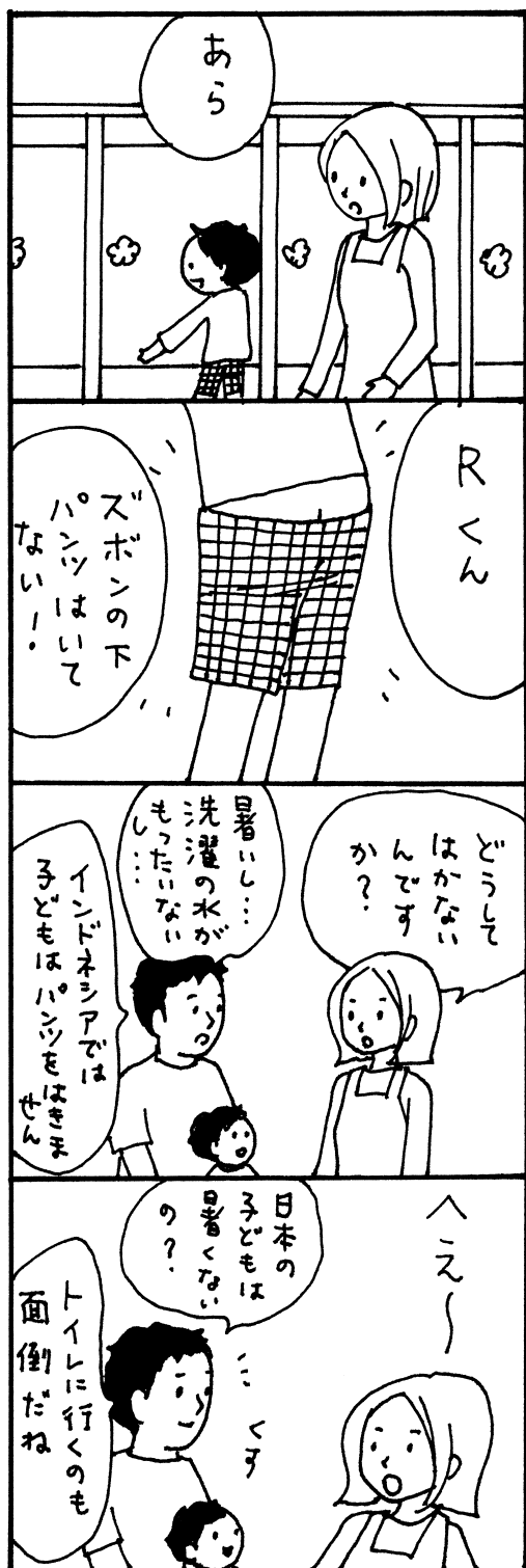
イラスト・うつろあきこ

R 君の父親は、インドネシア出身。入園初日、担任が「R君は、パンツ(下着)を穿いていません」といつてきました。たまたま穿き忘れたかもしれないため、少し様子を見ることにしました。しかし、R君は一向にパンツを穿いてきません。