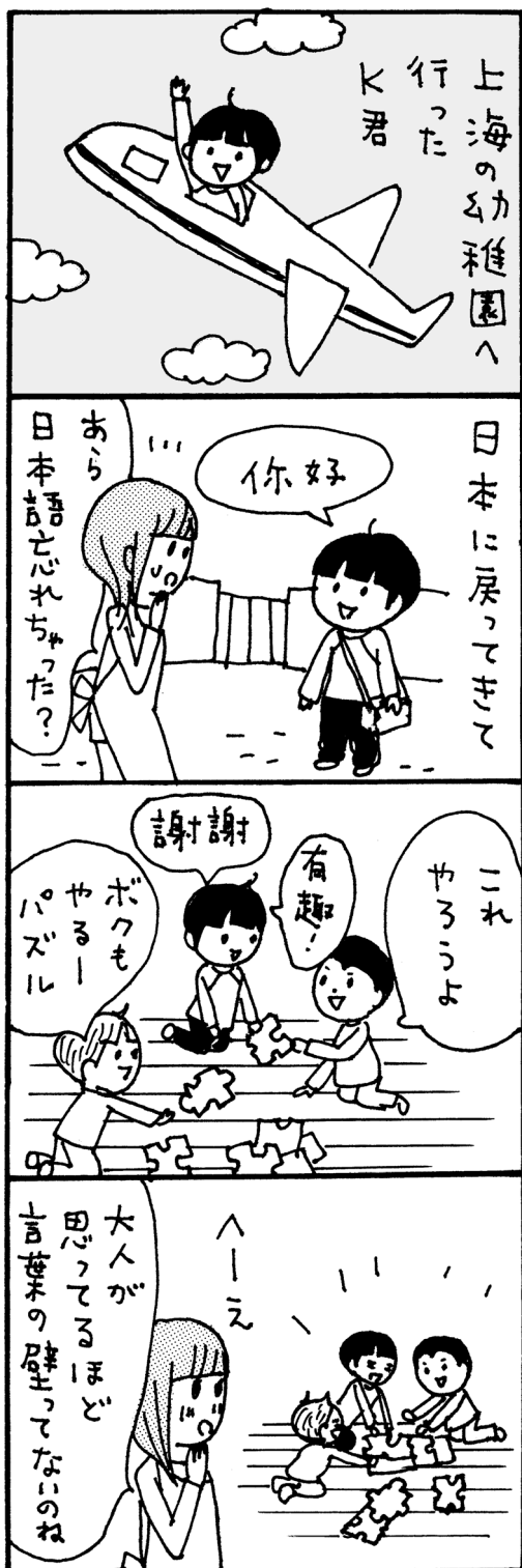
イラスト・うつろあきこ

お 父さんが日本人、お母さんが中国・上海市出身の4歳になるK君が、上海の小学校へ行くために昨年11月に退園しました。父母ともに日本で仕事をしていて、上海には母方の祖父母がいるのですが、K君は幼稚園寄宿舎生活とのこと。お別れするとき、甘えん坊のK君がいなくなる寂しさと、上海の幼稚園で大丈夫だろうかという心配で悲喜こもごもでした。