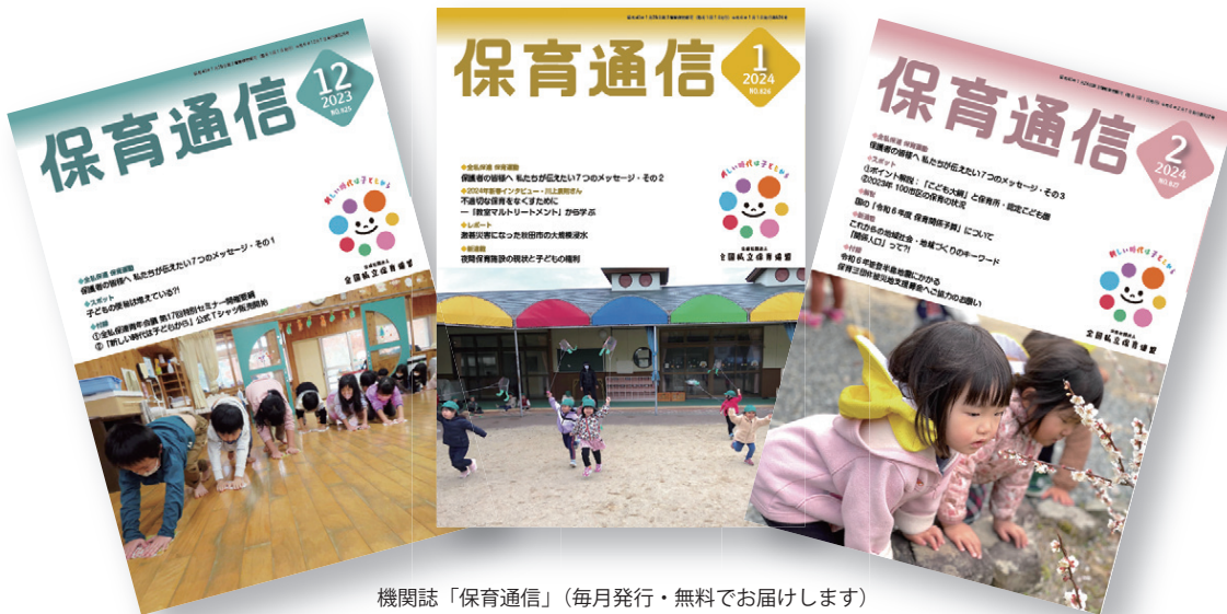
機関誌「保育通信」（毎月発行・無料でお届けします）