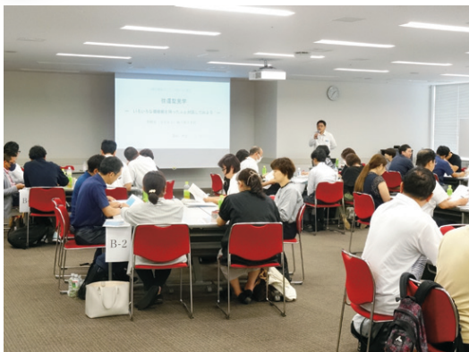
新任園長セミナーの様子（2023年7月）