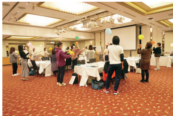
保育カウンセラー養成講座の様子